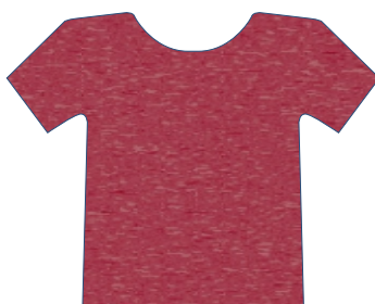
2601 VERMELHO ESCURO