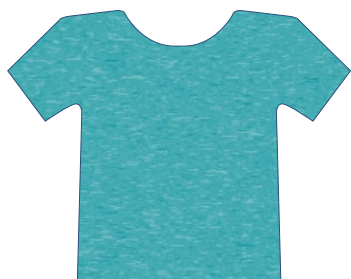
2005 AZUL SCUBA