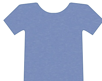
2001 AZUL CLARO