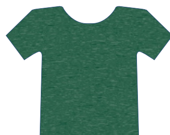
2502 VERDE ESCURO