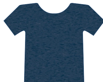
2003 AZUL MARINHO