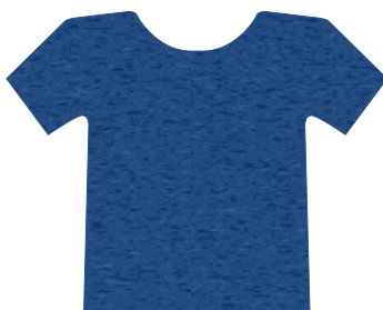
2002 AZUL ROYAL