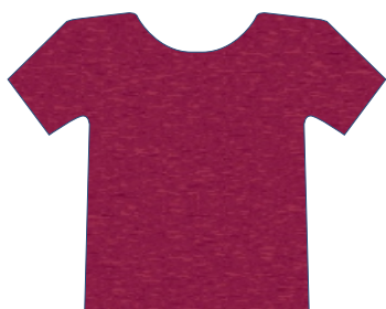
2602 VERMELHO FERRARI