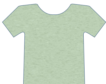
2506 VERDE PET