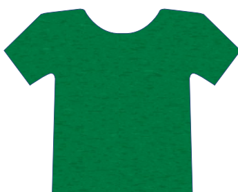
2503 VERDE AGRO