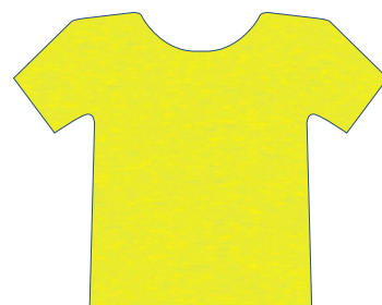
1203 AMARELO AIPO